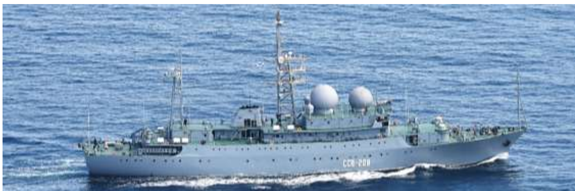
ヴィンニャ級情報収集艦（艦番号「208」）