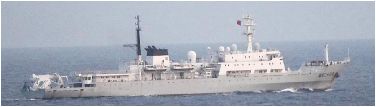
シュパン級測量艦 (艦番号「25」)