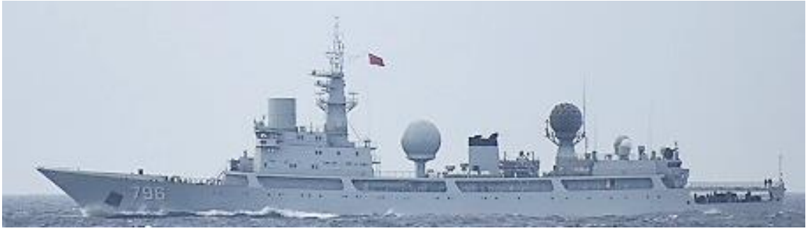
ドンディアオ級情報収集艦（艦番号「796」）