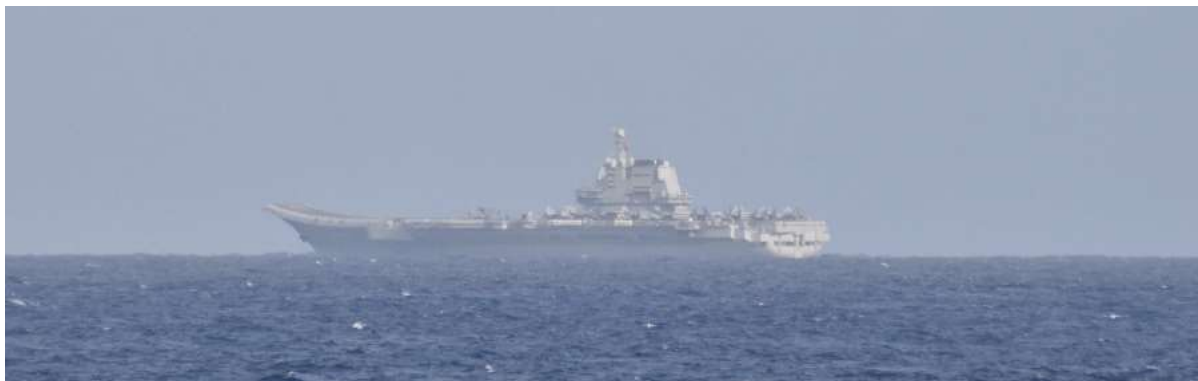
クズネツォフ級空母「山東」(艦番号「17」)