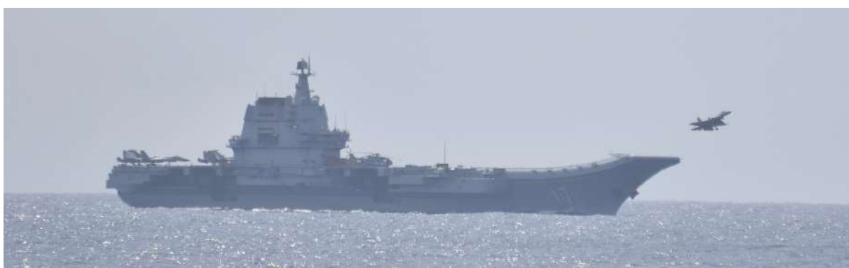
クズネツォフ級空母「山東」搭載戦闘機 (J-15)