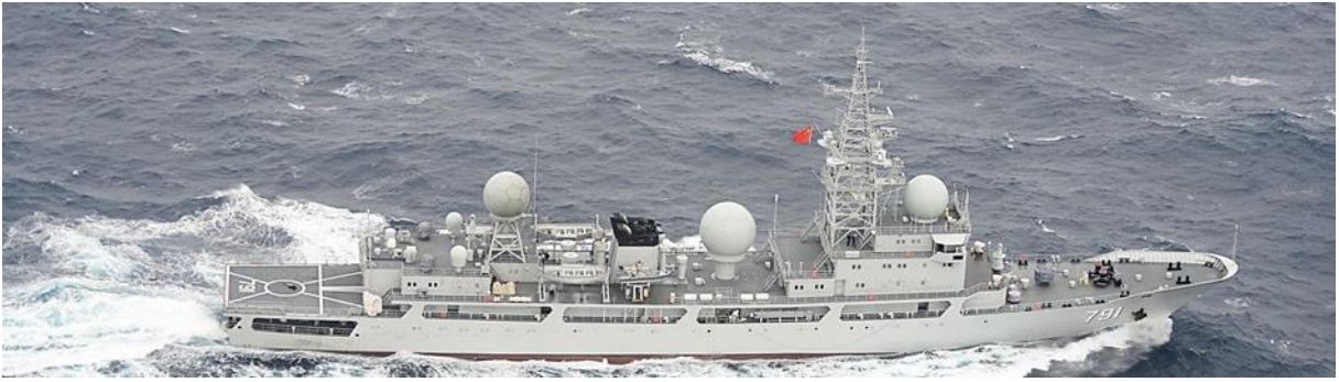
ドンディアオ級情報収集艦（艦番号「791」）