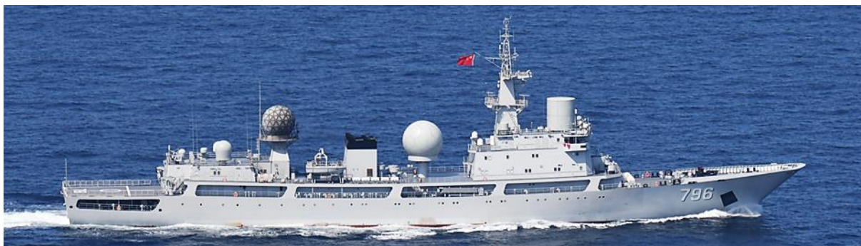
ドンディアオ級情報収集艦（艦番号「796」）