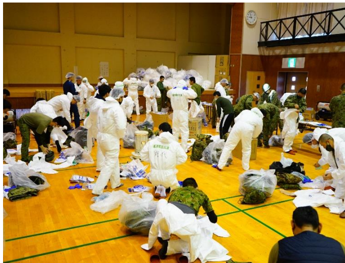
活動前準備の状況