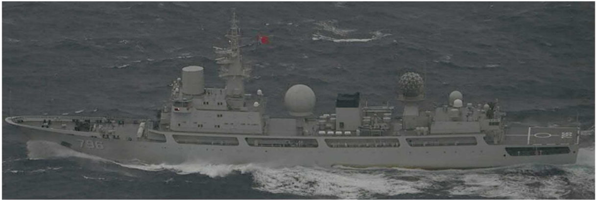
ドンディアオ級情報収集艦（艦番号「796」）