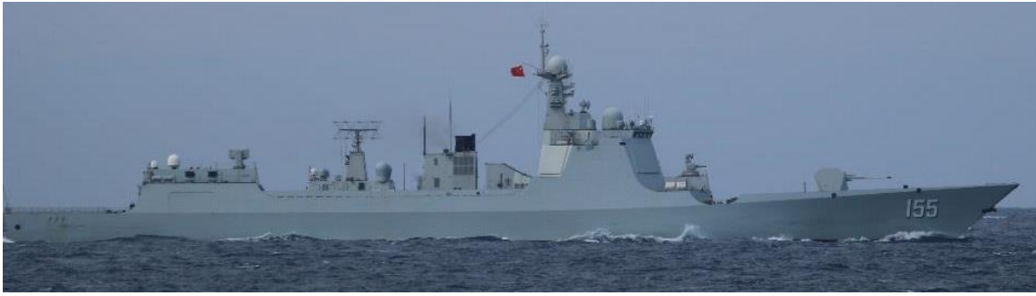
ルーヤンⅢ級ミサイル駆逐艦（艦番号「155」）