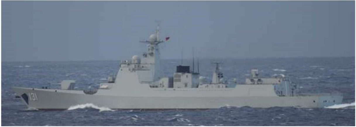
ルーヤンⅢ級ミサイル駆逐艦（艦番号「131」）