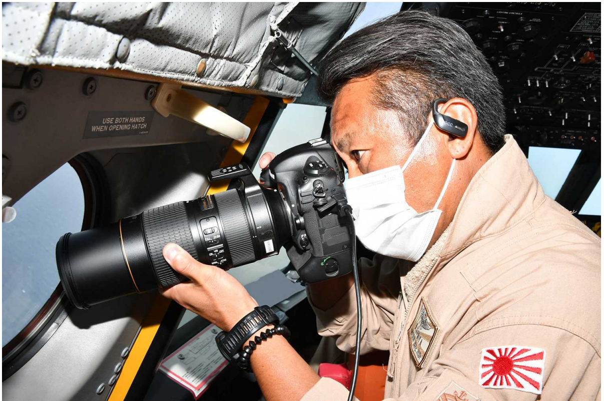
船舶の写真撮影を行うP-3C搭乗員