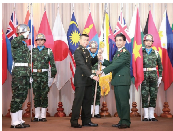
AAPTTC年次会合 開催国（タイ王国）（左）と 次期開催国（ベトナム社会主義共和国）（右）

AAPTTC Annual Meeting Convened in Thailand