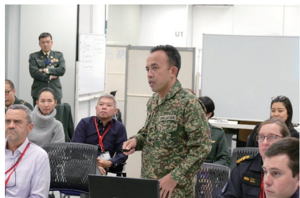
演習活動を報告する学生（中級課程） Participant reporting the exercise (UNSOC)