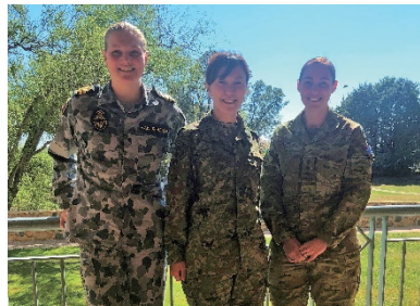
オーストラリアで行われた 国連司令部幕僚課程の同期学生 との写真撮影

By Captain NAKABAYASHI Yuki (attached to JGSDF Ground Component Command HQ)