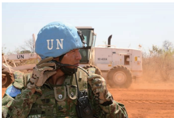
UNMISS（南スーダン）派遣施設隊による道路補修 Road Repair by UNMISS