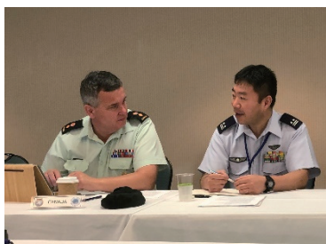
アジア太平洋地域平和維持活動・能力構築支援専門家会同に参加した国際平和協力センター職員 (撮影地：アメリカ合衆国（ハワイ州）)

JPC promoted international exchanges and participated in exercises around the world.