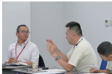
有識者との意見交換する隊員 JPC members and other JSDF members exchanging opinions with the expert