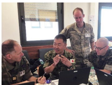
ニューカレドニア駐留仏軍主催多国籍間共同訓練「赤道19」に参加した国際平和協力センター職員 (撮影地：フランス領ニューカレドニア)

JPC officer who attended the 2020 Regional Peacekeeping Operations Capability and Capacity Building Technical work Group in Honolulu (Photographed in Hawaii)