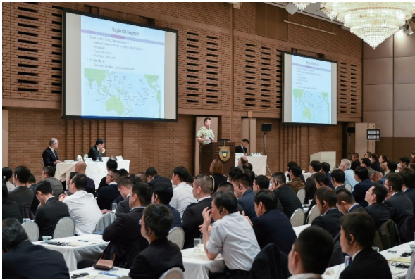
国際平和と安全シンポジウム

International Peace & Security Symposium