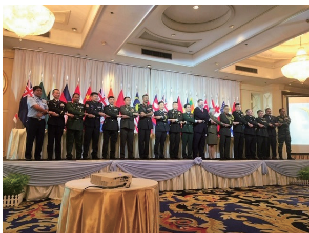
タイ王国で行われたAAPTTC年次会合

The JPC makes continuous efforts in improving its training curriculum and increasing necessary knowledge of JPC researchers by collecting information and exchanging views through active participation in world wide annual meetings and conferences where representatives of foreign institutions engaged in education and research on peacebuilding discuss how to improve international peace cooperation activities as well as in regional meetings where instructors and researchers from PKO centers in Asia-Pacific countries discuss the measures for capacity building necessary for undertaking PKO.