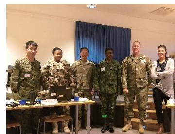
スウェーデン国防軍国際センターが実施する民軍連携課程に参加した国際平和協力センター職員 (撮影地：スウェーデン)

JPC officer in the multinational exercise “Equateur” hosted by the Armed Forces in New Caledonia (Photographed in New Caledonia)