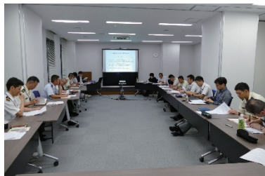
平和活動研究会の様子 Peace operations seminar

JPC hosted peace operations seminars, exchanging opinions with experts.