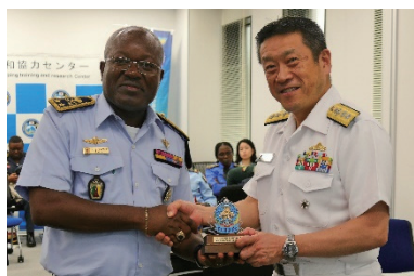
カメルーン治安・平和部隊国際学校長 ビトテ・アンドレ・パトリス准将と 泉前統合幕僚学校副校長

JPC welcomed visitors from around the world, promoting international exchanges.