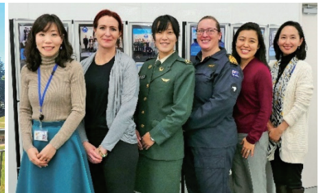
中級課程同期学生及び教官等 との写真撮影