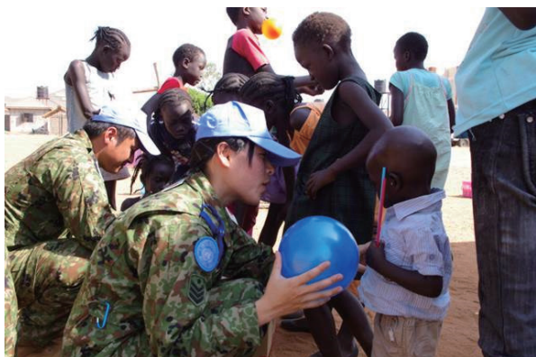
UNMISS（南スーダン）派遣施設隊による孤児院慰問 Orphanage Visits by UNMISS

Since then, Japan has sent SDF units and HQ personnel to such operations as the UN Disengagement Observer Force (UNDOF), the UN Stabilization Mission in Haiti (MINUSTAH), and the UN Mission in South Sudan (UNMISS). Four SDF personnel are recurrently assigned to the UNMISS to serve in the HQ.