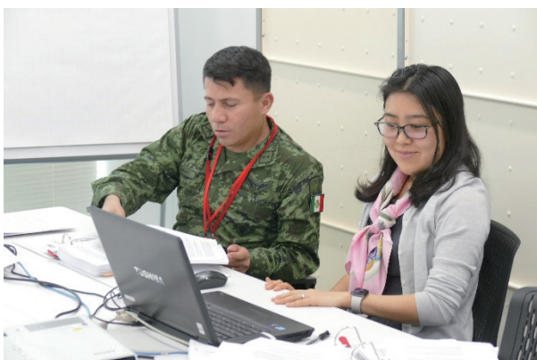
グループ作業する学生（中級課程） Participants in the group work (UNSOC)