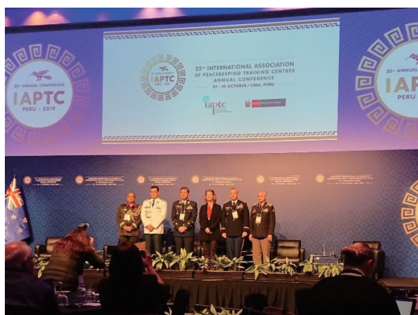
ペルー共和国で行われたIAPTC年次会合

Host country Thailand (Left) and the next host country Vietnam (Right) of the AAPTTC Annual Meeting