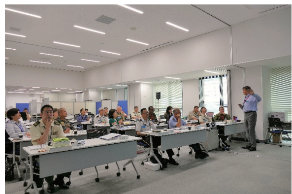
教官による授業風景（上級課程） Lecture by the Instructor (PKOCCC)