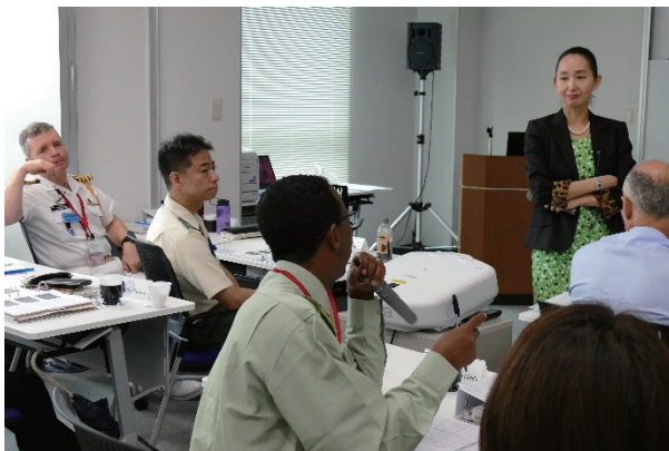
質問する学生（上級課程） Questions and Answers (PKOCCC)

Also, education on the knowledge necessary to act in accordance with relevant regulations peculiar to Japan is included in the course curriculum.