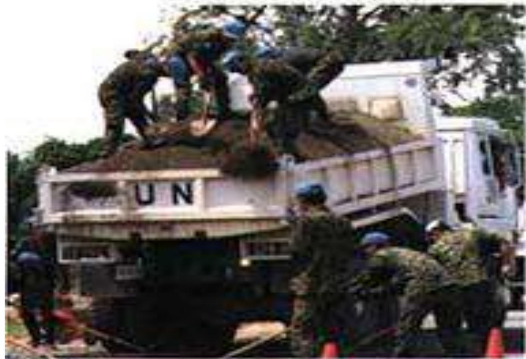
Restoration work along National Route 3