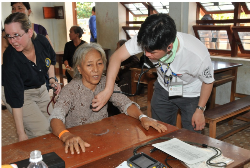
自衛隊医療チームによる内科診療