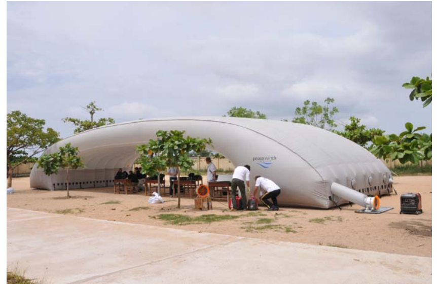
NGOのシェルターを本部要員の待機場所として使用