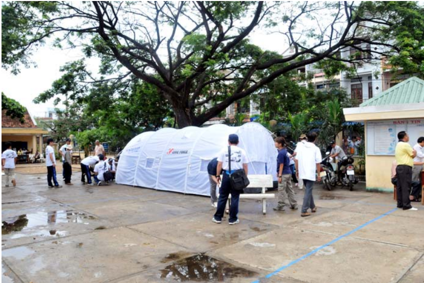
NGO医療支援用テントを展張