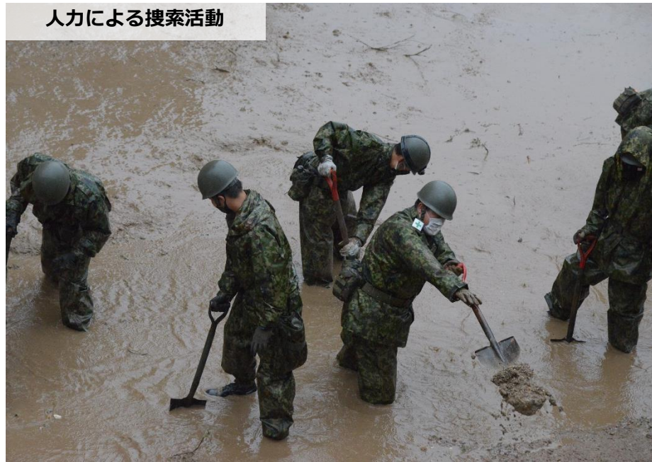
人力による捜索活動