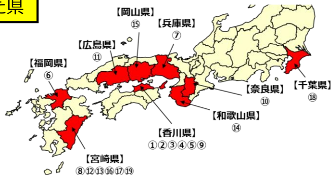
自衛隊が対応した県