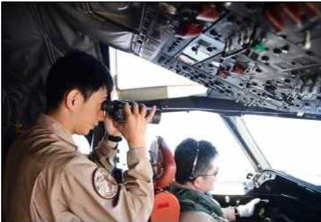
船舶を確認中のP-3C搭乗員