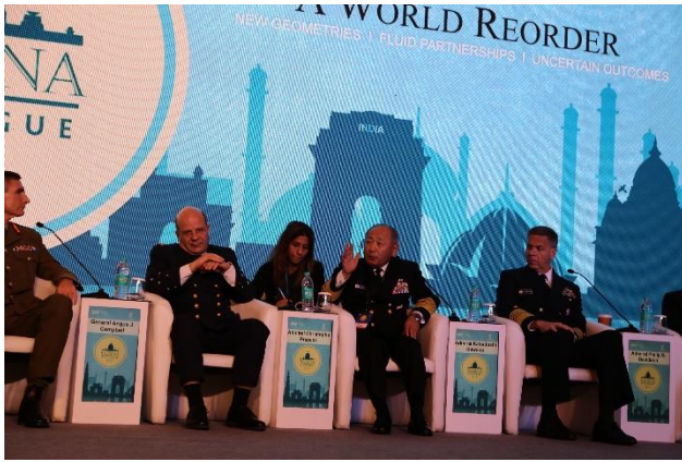
ライシナ・ダイアローグ