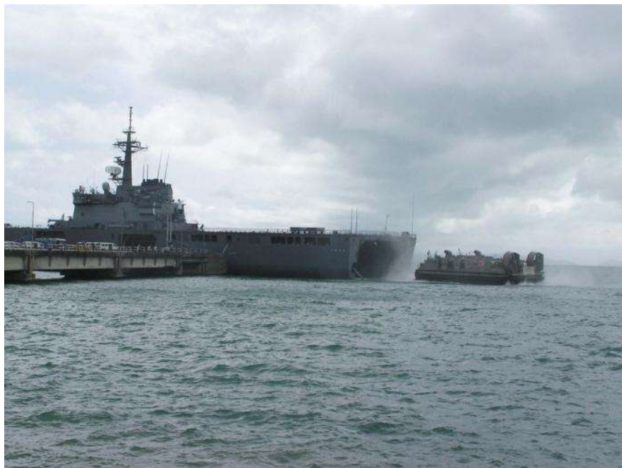
シアヌークビル港湾係留中の「くにさき」から発進するLCAC