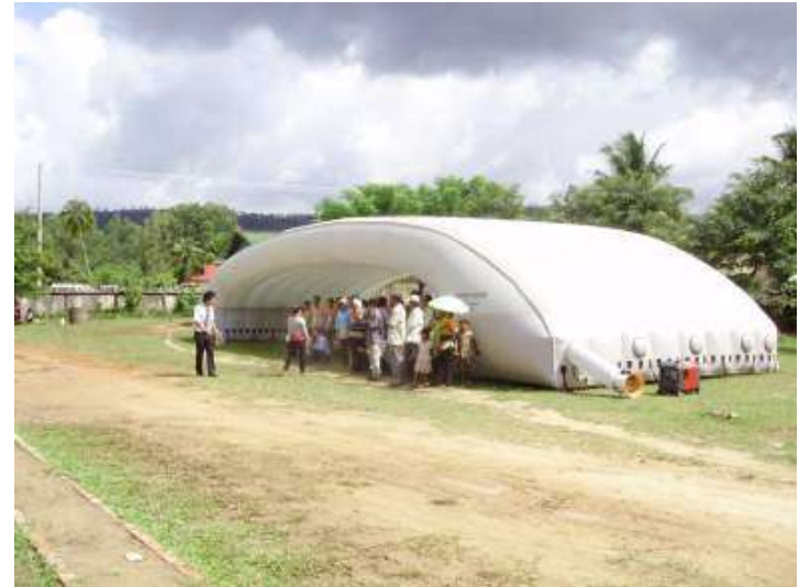
NGOのシェルターを患者待機場所として使用