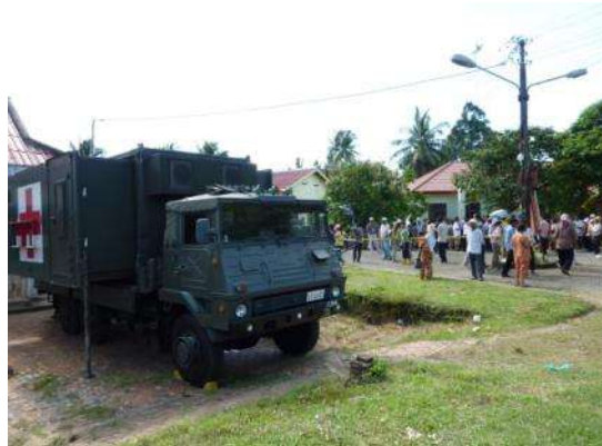
医療活動現場に診療ブースとして設置された陸自医療用車両(シアヌーク州立病院)