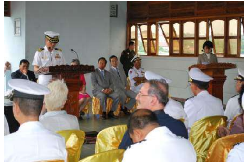
閉会式(シアヌークビル港)