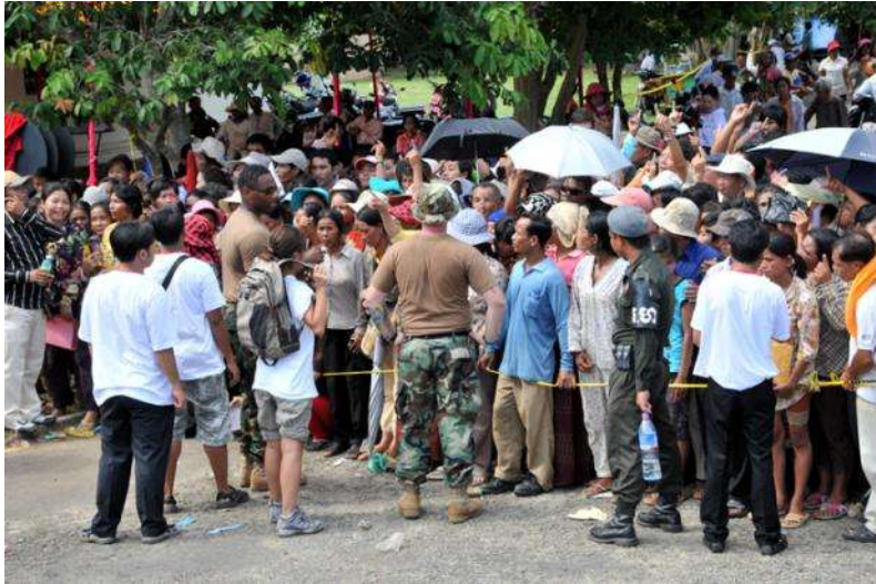
受診のため受付に集まる、カンボジアの住民ら