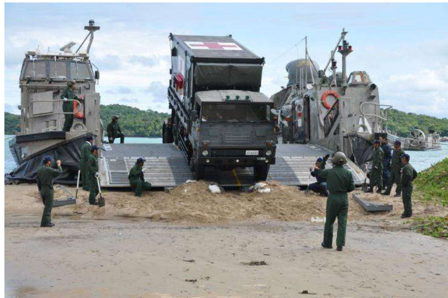
レアム海軍基地へ陸自医療用車両を輸送