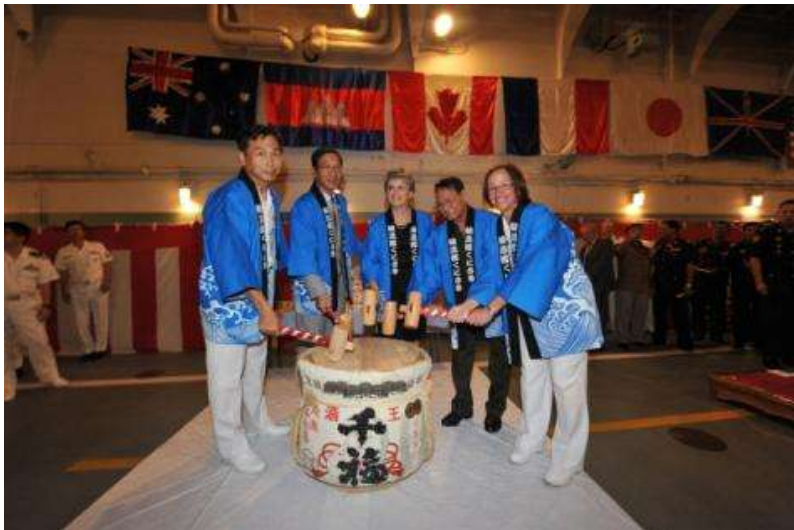
活動終了前日、「くにさき」艦内で行われたレセプションの様子