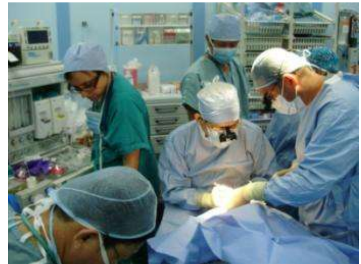
口唇口蓋裂手術（NGO：米海軍病院船マーシー内）