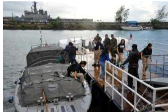
人員輸送する海自作業艇