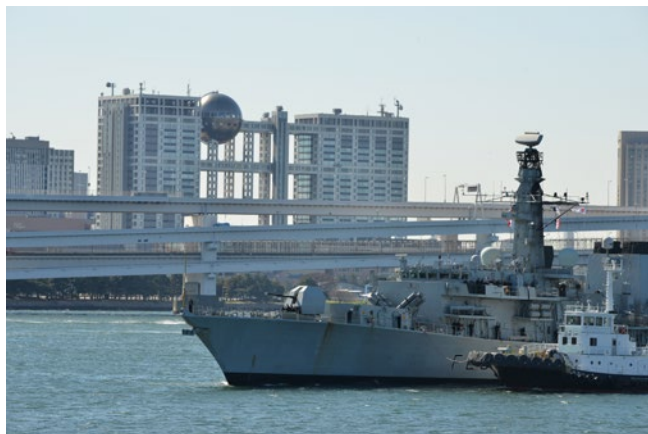
瀬取り監視のために訪日した英「モントローズ」