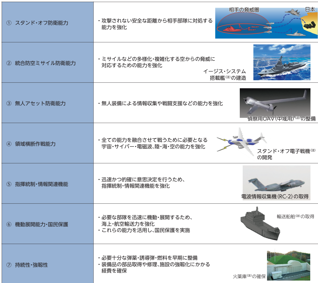
図表Ⅱ-2-2-3 防衛力の抜本的強化にあたって重視する7つの機能・能力とそのイメージ