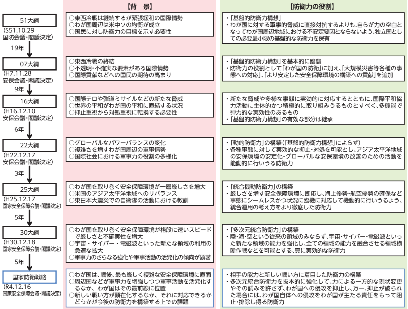
図表Ⅱ-2-2-1 防衛力の役割の変化