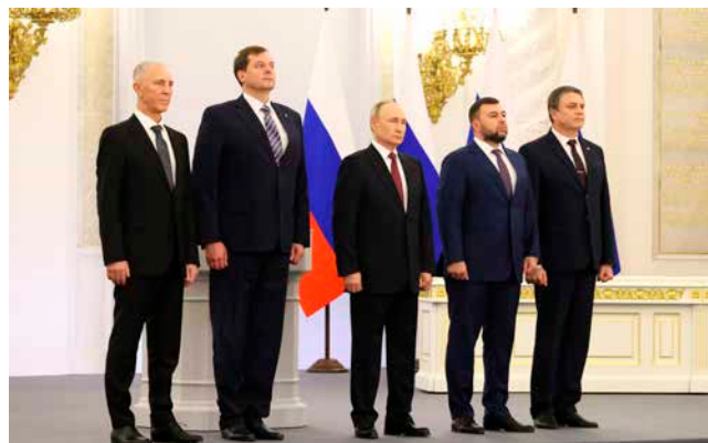
ウクライナ東部および南部4州の「編入」式典におけるプーチン大統領（中央）、4州の「首長」および「行政長官」（2022年9月）

ウクライナ領土占領の既成事実化については、同月23日から27日にかけて、ルハンスク、ドネツク、ザポリジャ、ヘルソンのロシア軍占領地域においてロシアへの「編入」の賛否を問う「住民投票」と称する活動を実施し、その結果に基づき、同月30日、これら4地域を違法に「併合」した。