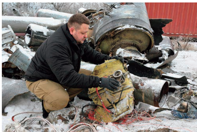
ウクライナ北東部ハルキウへの攻撃で使用された北朝鮮製とされるミサイルの残骸を調べる検察関係者（ウクライナ・ハルキウ）（2024年1月）

一方、ウクライナ軍の装備の多くは、旧ソ連製であり、ロシア以外の国から調達できる部品や弾薬は限られている。さらに、自国内で修繕や調達が可能な装備についても、主要な軍需企業が立地するハルキウやドニプロはロシア地上軍の攻撃圏内にある。こうしたことから、継戦能力の確保のためには、国外からの装備・弾薬の提供と旧ソ連製装備からの転換にかかわる教育訓練支援が重要である。