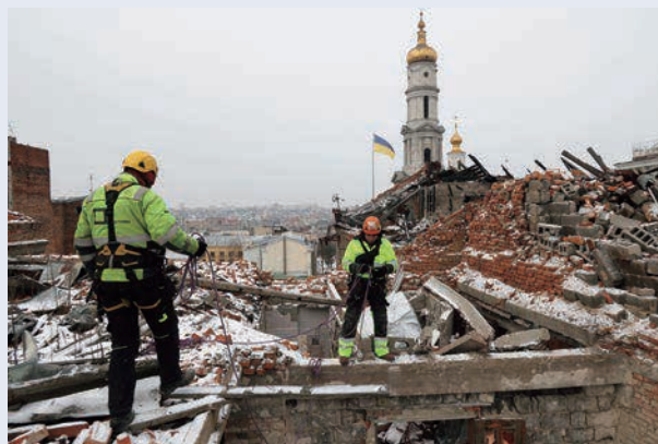
ハルキウへの砲撃後に再建作業を行う事業者

今後、ロシアが武力行使を終えたとき、ウクライナが強靱でロシアへの損害が大きすぎることを実感していれば、再び武力行使を始める動機は小さくなるでしょう。ウクライナが現在の厳しい戦いを行うことには、将来の平和を支える意味もあります。「武力行使が成果をもたらす」と誤解する余地があるのは危険で、それを減らしていく能力と意思が、平和の基盤になります。