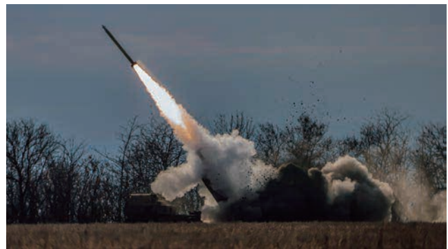
発射されるウクライナ軍の高機動ロケットシステムHIMARS (ウクライナ南部ヘルソン州)

ウクライナ南部においては、ロシア軍は、アゾフ海沿岸におけるウクライナ側の最後の拠点であったドネツク州南部マリウポリにあるアゾフスターリ製鉄所の制圧に戦力を集中し、同年5月、ロシア国防省は、ショイグ国防相(当時)がプーチン大統領に対し、同製鉄所構内の