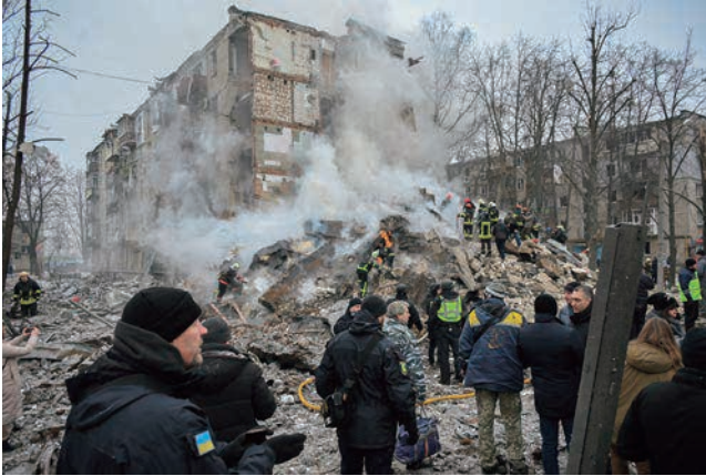
ウクライナ・ハルキウの被害状況 (2024年1月)

は2024年春季も継続しているが、防空装備の不足がウクライナ側の被害を拡大させているとされる。