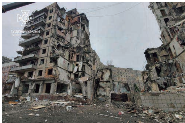
2023年1月14日のロシア軍のミサイル攻撃により破壊された ウクライナ中部ドニプロの集合住宅（2023年1月）

るとともに、寒冷期の市民生活にとって重要なウクライナの電力網に被害を与え、非戦闘員の犠牲を拡大することで、ウクライナの継戦能力と抗戦意思の減殺を企図したものとみられる。こうしたロシア軍の攻撃によるウクライナの非戦闘員の犠牲者は、国連人権高等弁務官事務所によると2023年11月時点で少なくとも1万人を超えるとの見方が示されているが、戦闘が現在も継続しているため、正確な被害の実態は把握できておらず、実際の犠牲者はこれを大きく上回り、今もなお増え続けているとみられる。