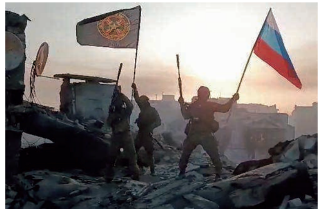
ロシア国旗を掲げる「ワグネル」戦闘員 (2023年5月)

ロシア軍については、指揮統制をめぐる困難がとりわけ早くから指摘されてきた。侵略開始当初、ロシア軍は、平時の運用体制である統合戦略コマンド（軍管区）の指揮系統と所属部隊をそのまま各作戦正面に割り当てた結果、約20万人とされる機械化歩兵部隊に加え、陸・海・空のミサイル戦力、海空戦力などの投入戦力全体 1 に対する一元的な指揮統制を欠いたと指摘されている。2022年4月初旬には、ロシア軍の作戦全体を指揮する統合任務部隊司令官が任命されたと報じられ、軍種間や戦域間の連携改善を図ったものとみられる。また、2023年1月には、軍種間の連携改善、後方支援の質的向上や部隊指揮の効率改善を目的として、ゲラシモフ参謀総長が統合任務部隊司令官に任命された旨発表された。同年5月には、プリゴジン氏率いる民間軍事会社「ワグネル」の兵力も多数投入することで、東部ドネツク州バフムトの制圧に寄与したとされるが、その後、軍と「ワグネル」