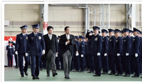
航空観閲式における岸田内閣総理大臣と木原防衛大臣 (2023年11月)