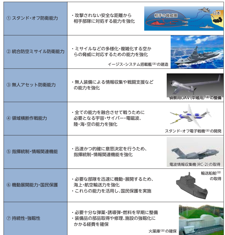
図表Ⅱ-2-2-3 防衛力の抜本的強化にあたって重視する7つの機能・能力とそのイメージ (注)印の図はイメージ。