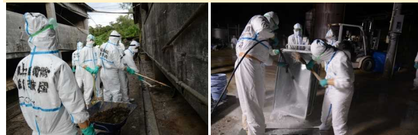
豚舎周辺の清掃支援作業