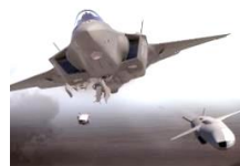
JSM (2025年度から 納入予定)