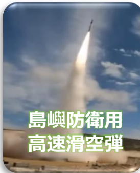
島嶼防衛用 高速滑空弾