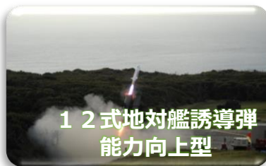
12式地对艦誘導弾 能力向上型