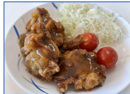
空自奥尻島分屯基地：うにソース空上げ (奥尻産ワイン、奥尻産うにを使用)