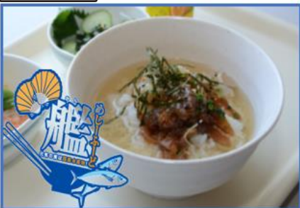
海自大村航空基地隊：あじ茶漬け (長崎県産あじを使用)