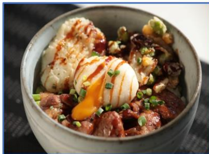
陸自帯広駐屯地：とろ〜り卵のとちか井 (十勝産のホエイ豚、川西長いもを使用)