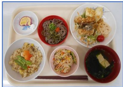
陸自出雲駐屯地：秋の炊き込みご飯、出雲そば (出雲産の出雲そば、西浜芋を使用)