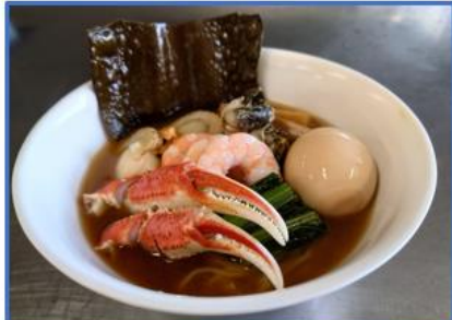
空自襟裳分屯基地：襟裳ラーメン (えりも町産のつぶ貝、大ずわいがに、昆布を使用)