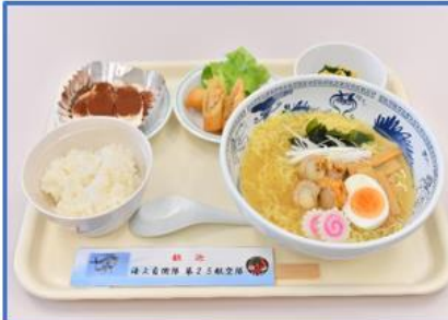
海自第25航空隊：ホタテラーメン (青森県産のホタテを使用)