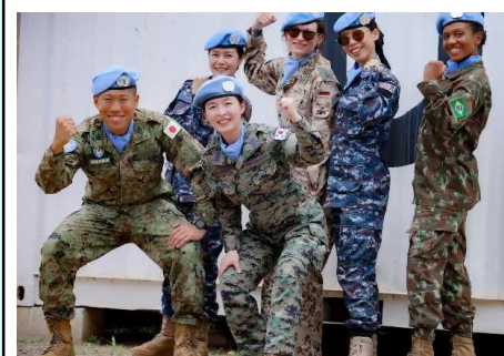
ルワンダ隊マルパレード