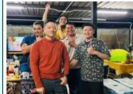
タイ及びカナダ隊と夕食