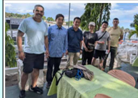
兵站・航空運用幕僚歓迎会