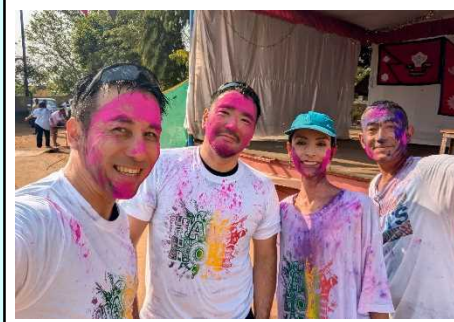
ネパール隊の春の祭典行事