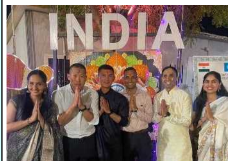
インド隊の春の祭典行事