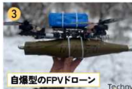
自爆型のFPVドローン

①出典: Petro Poroshenko Foundation SHATRO 50-1M electronic warfare system ②出典: Military (Photo by Petro Poroshenko Press Service) https://defencesecurityasia.com/en/fpv-drones-poses-increasing-threat-russia-equips-tanks-with-ew-systems/#google_vignette ③出典: Tochnyi.info https://tochnyi.info/2024/01/fpv-data-analysis/