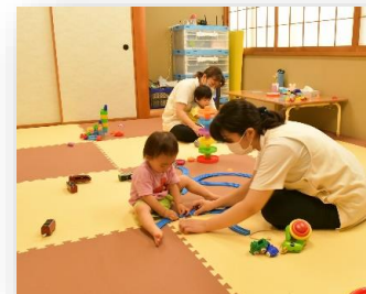
臨時託児事業 【自衛隊中央病院（陸自）】