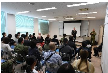
海外派遣時の家族説明会の実施

海外派遣等で長期に派遣される隊員の留守家族が不安を抱かぬよう、所属部隊等に留守家族専用の相談窓口の設置や、家族と派遣隊員との連絡手段を確保するなど様々な留守家族支援施策を実施