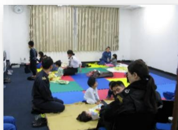
緊急登庁支援 【大村航空基地（海自）】