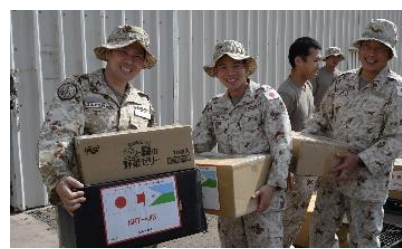
隊員家族からの慰問品の送付