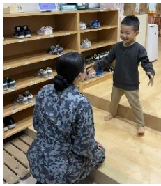
庁内託児施設 【入間基地（空自）】