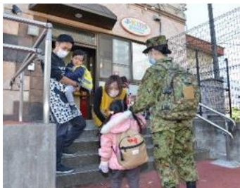
庁内託児施設 【三宿駐屯地（陸自）】