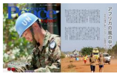
隊員の活動状況を広報誌等で情報提供