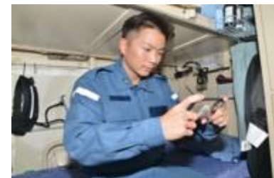
派遣隊員と留守家族間の連絡手段の確保