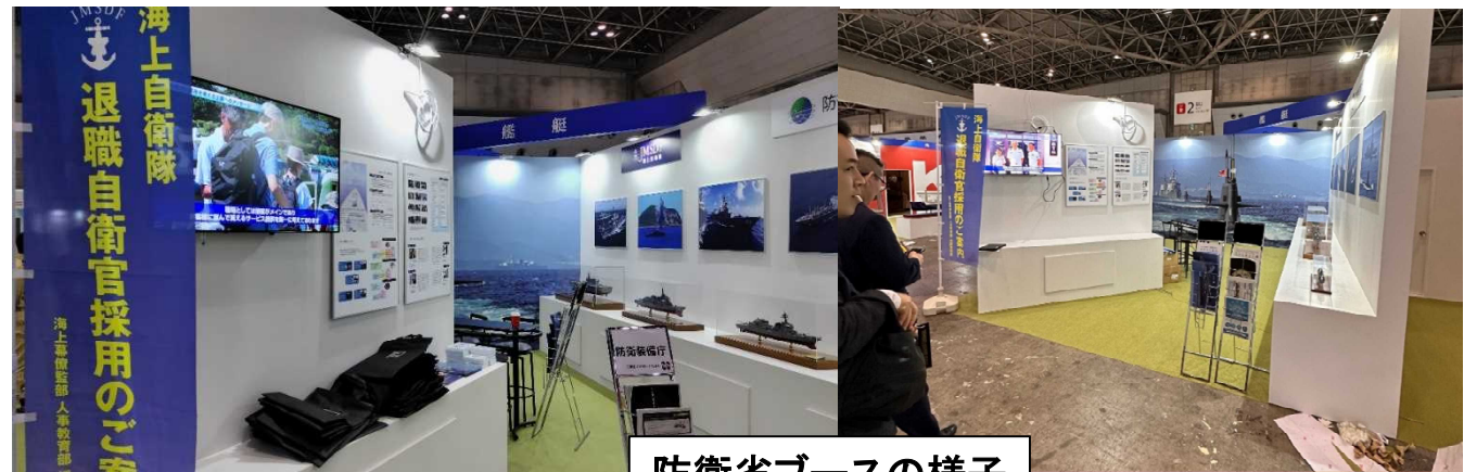
防衛省ブースの様子