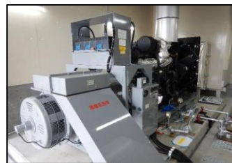
発電機 (イメージ) 【非常用電源施設】