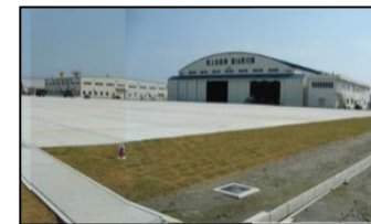
駐機場(イメージ) 【佐賀駐屯地（仮称）の整備】