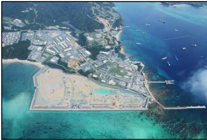
【普天間飛行場代替施設の建設】