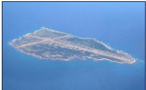
【馬毛島における施設整備】