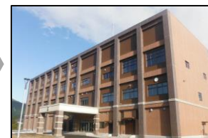
建て替え (イメージ) 【庁舎の耐震化対策】