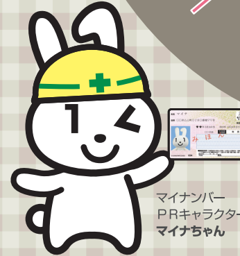
マイナンバー PRキャラクター マイナちゃん