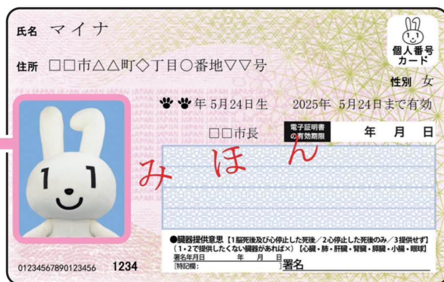
< おもて面 >