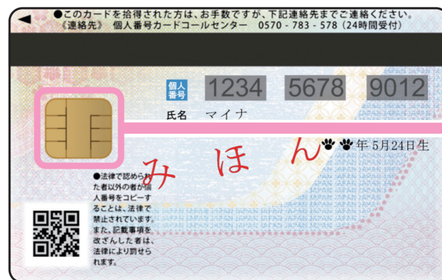
< うら面 >

うら面のICチップに あなた本人である ことを証明する、 「電子証明書」 が入っているよ!