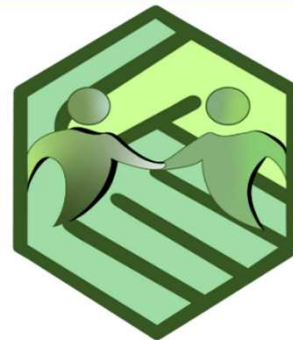
防衛省と地域社会との協力を象徴するエンブレム