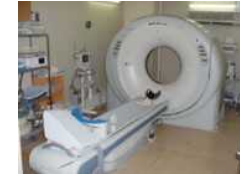
医療施設（医療機器）