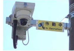
環境衛生施設（防犯カメラ）