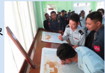
(例: 航空気象に関する能力構築支援)