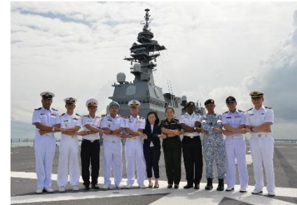
(乗艦協力プログラムの参加者)