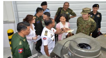
(災害派遣関連装備品の展示)