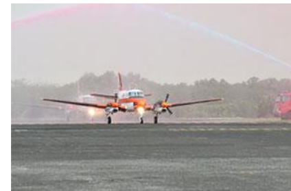
(中古装備品の移転)