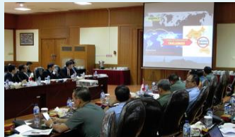
(例: 官民防衛産業フォーラム)