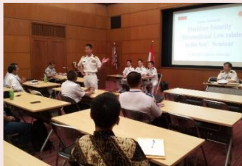
(例: 国際海洋法セミナー)