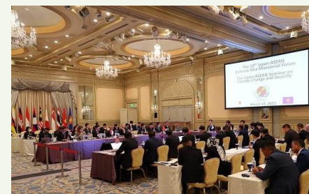
日ASEAN環境安全保障セミナー (2023年3月)