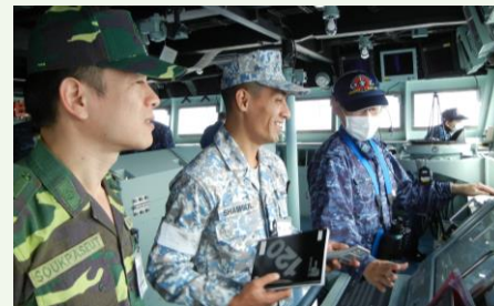
日ASEAN乗艦協カプログラム (2023年8月)