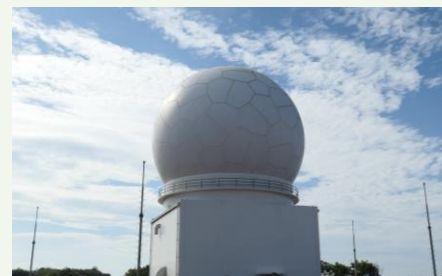
フィリピンへの警戒管制レーダーの移転 (2023年10月に1基目を納入)