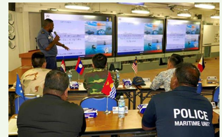
日太平洋島嶼国及び東ティモール 乗艦協カプログラム (2023年8月)