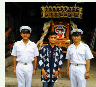
留学生の受け入れ