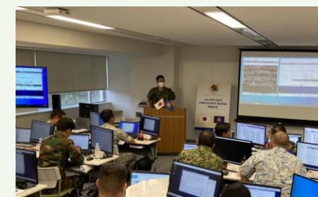
日ASEAN防衛当局サイバー セキュリティ能力構築支援 (2023年11月)