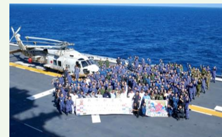
日ASEAN乗艦協力プログラム (2023年8月)