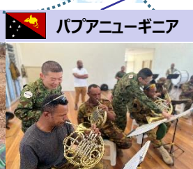
パプアニューギニア