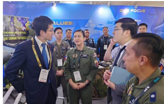
海外企業等のブースの視察