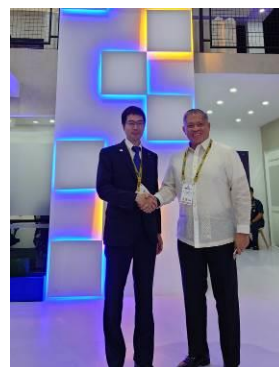
ミソン・フィリピン国防次官（取得・資源管理担当）との会談