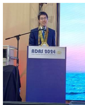
シンポジウムにおける基調講演