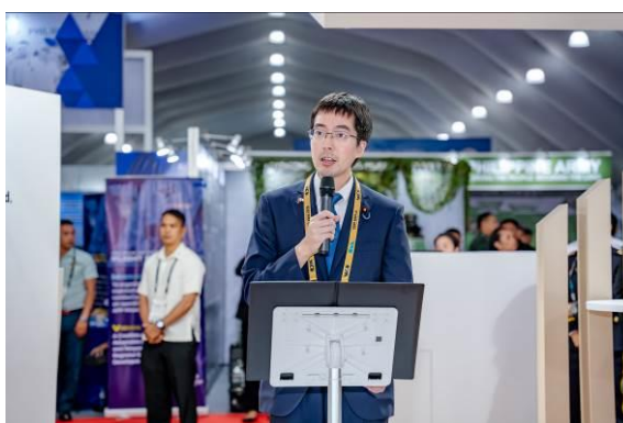
防衛装備庁ブースレセプションでの挨拶