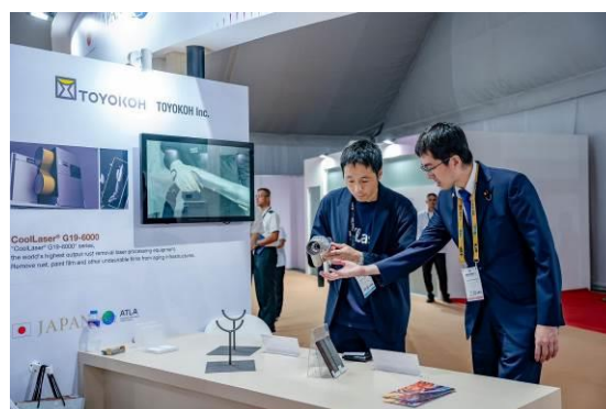
防衛装備庁ブースにおける日本企業激励