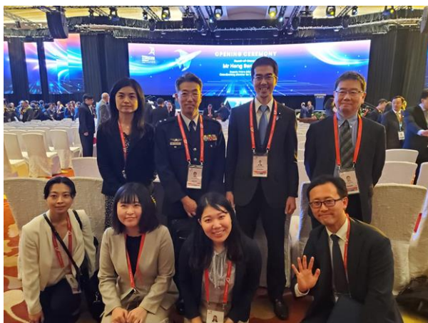
オープニング・セレモニー