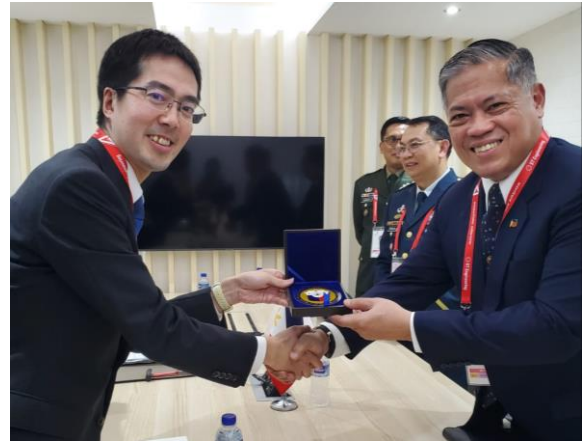
ミソン・フィリピン国防次官 （取得及び資源管理担当）との会談