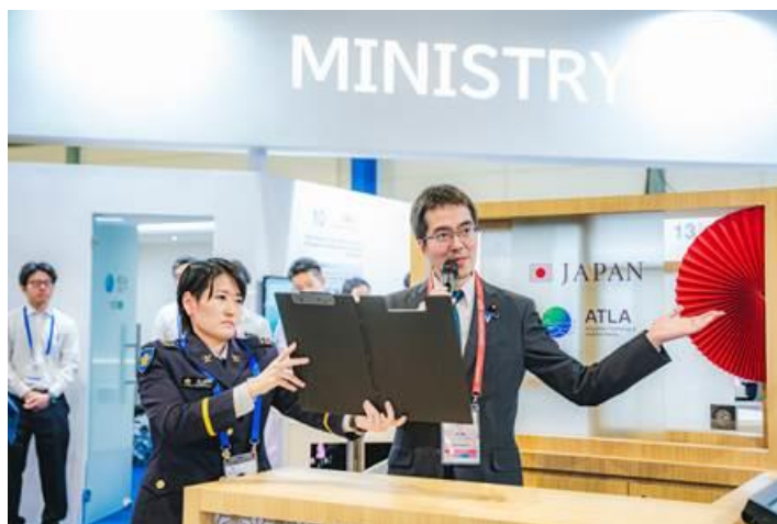
防衛装備庁ブースレセプションでの乾杯の挨拶