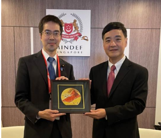
ヘン・シンガポール国防担当上級国務大臣 との会談