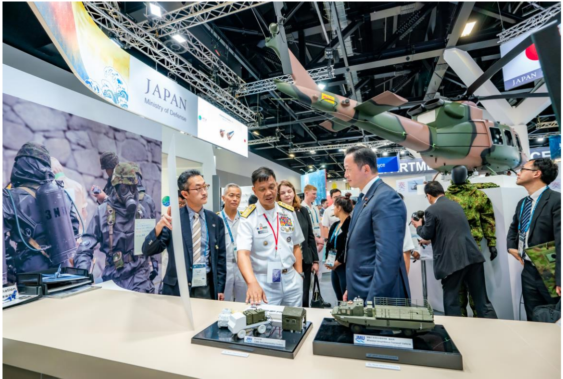
フィリピン海軍高官によるブース訪問