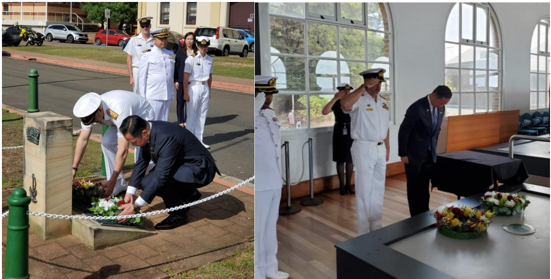
クッタバル慰霊碑及び旧日本海軍特殊潜航艇「松尾艇」（海軍歴史遺産センター内）への献花