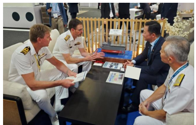
豪州海軍高官によるブース訪問