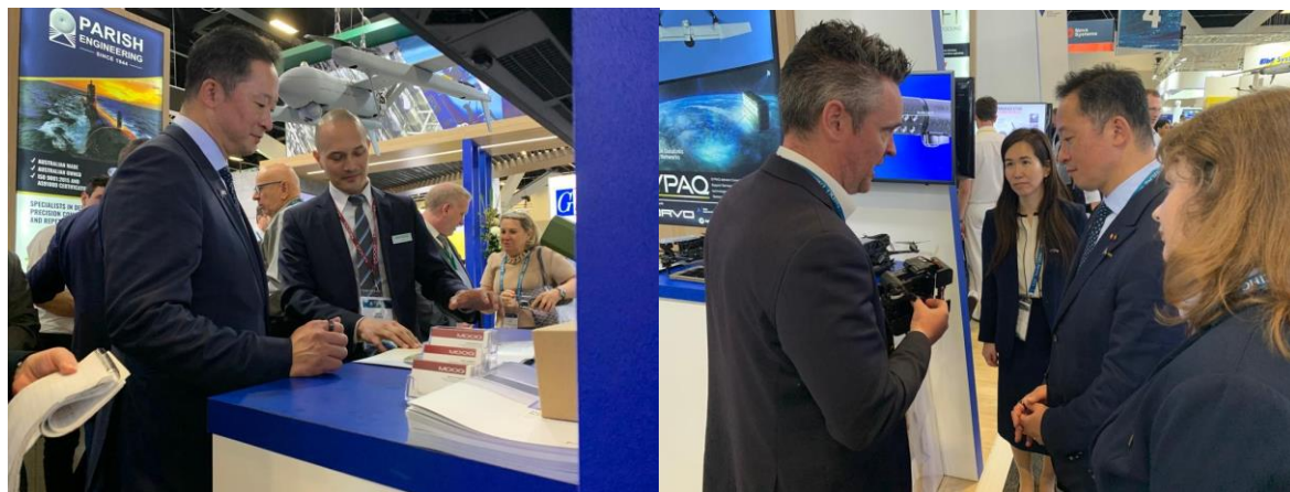
豪州企業ブースの視察