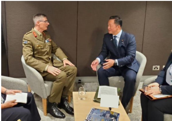
豪州国防軍キャンベル司令官との会談

2 同日、和田防衛大臣補佐官は会場において豪州国防軍キャンベル司令官と会談を行いました。会談では、日豪協力の重要性を再確認するとともに、和田防衛大臣補佐官から、装備品移転について直接働きかけを行いました。その後、キャンベル司令官を防衛装備庁ブースに招待し、日本の防衛関連企業と一体となって、日本の装備品の魅力や防衛産業の高い技術力をより一層アピールしました。