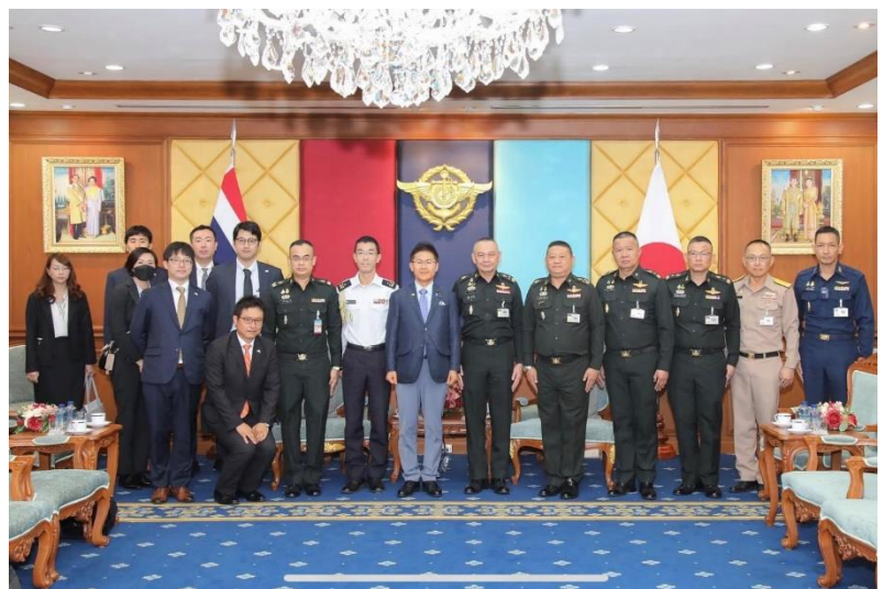
ティティチャイ統合参謀長との会談