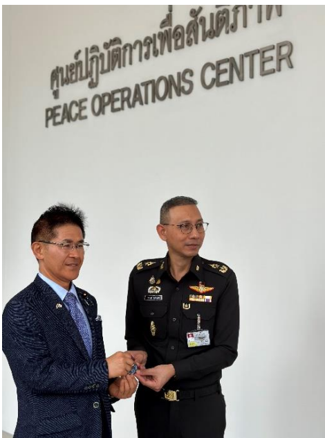
タイ王国PKOセンターへの訪問