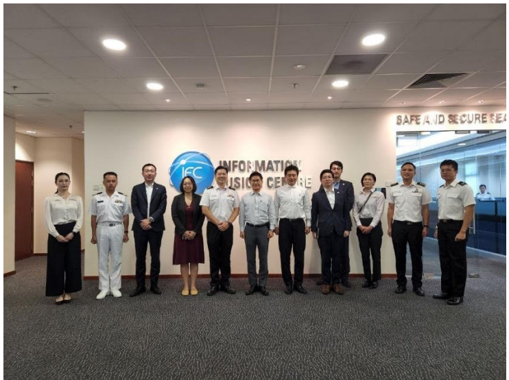
情報融合センターへの視察