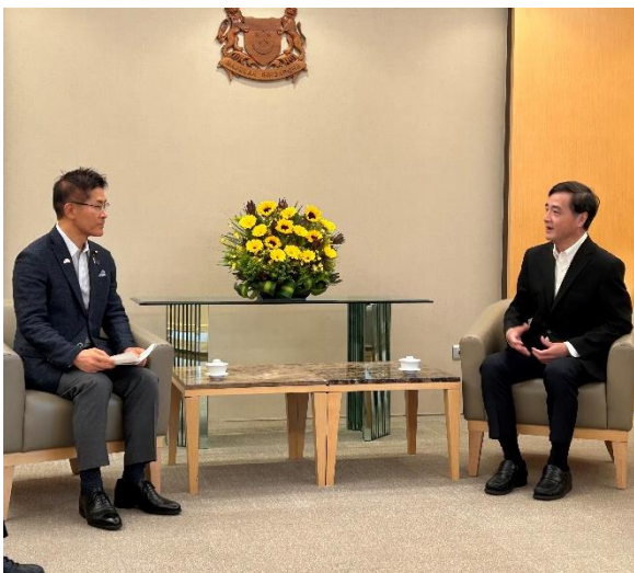
ヘン・チーハウ国防担当上級国務大臣との会談