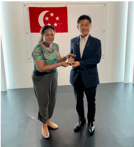
シンガポール海軍博物館への視察