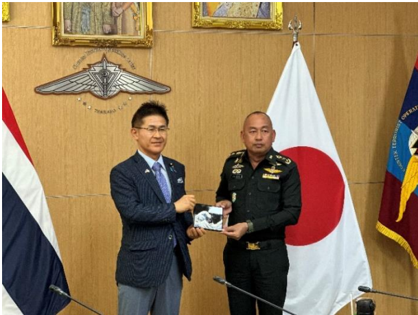
対テロ作戦コマンドへの訪問