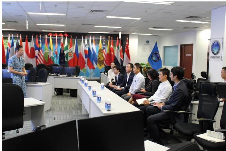
地域HADR調整センター（RHCC）への視察