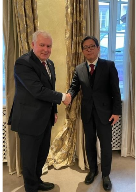
アヌシャウスカス・リトアニア国防大臣