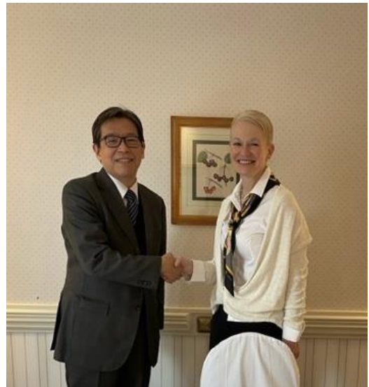
ワランダー米国防次官補