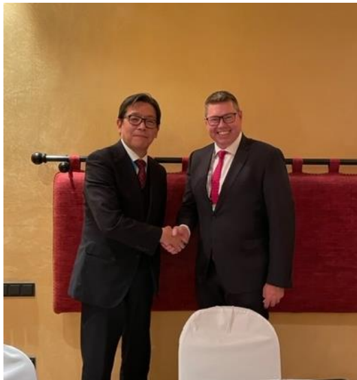
コンロイ豪国防産業大臣