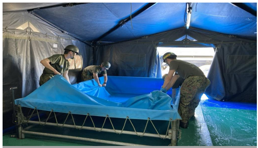
入浴支援活動（珠州市宝立小中学校）