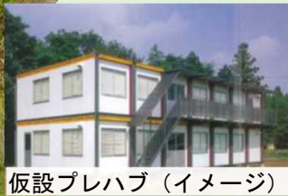
仮設プレハブ（イメージ）