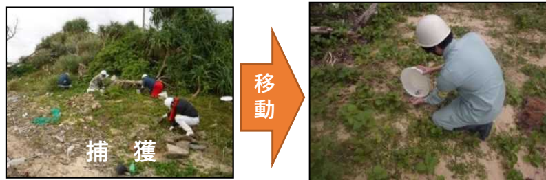
＜オカヤドカリ類の移動イメージ＞