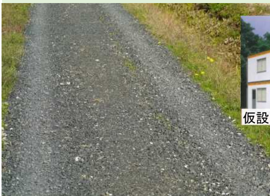
暫定的な管理用道路 （イメージ）

また、暫定的な管理用の砂利道の整備に際し、工事作業員等のための仮設プレハブ（2階建て、8棟）を設置します。