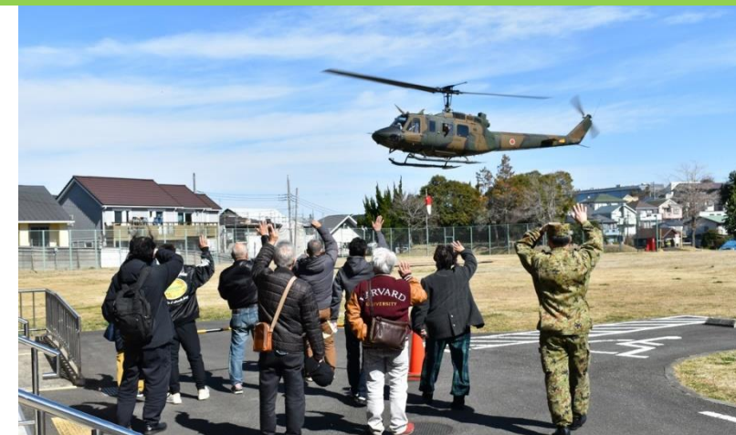
最後はみなさんとヘリコプターを見送りました！