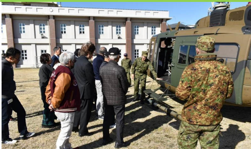
パイロットによる安全説明

2月28日（水） 天候は快晴！風も弱まりヘリコプターの飛行が可能になり、23名が体験搭乗できました。