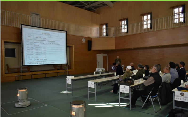
体験喫食及び体験搭乗について説明

2月27日（火） 天気は良かったものの強風のためヘリコプターの飛行ができず、体験喫食のみを実施いたしました。