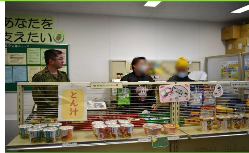
売店へのご案内もさせていただきました！

2月28日（水） 天候は快晴！風も弱まりヘリコプターの飛行が可能になり、23名が体験搭乗できました。