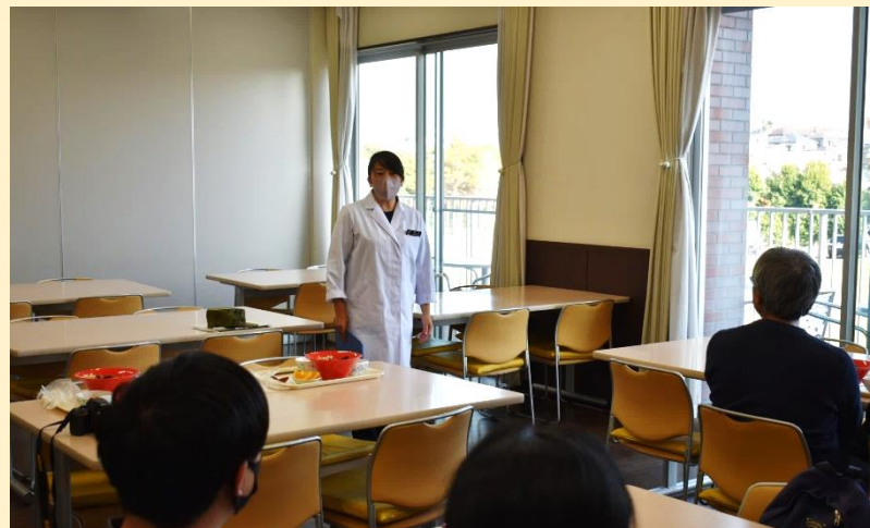
栄養士による献立説明