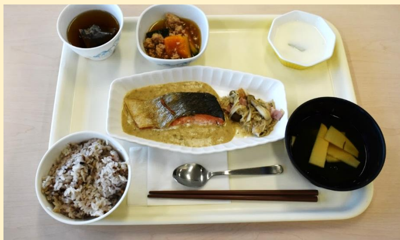
12月はお魚料理を喫食していただきました！