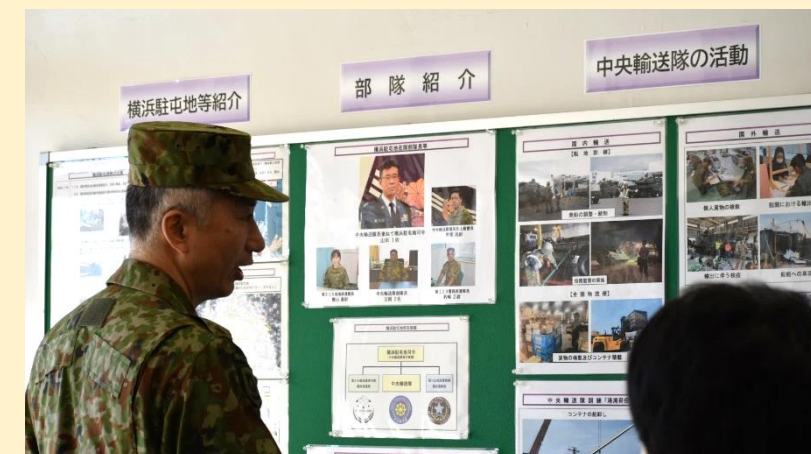
みなさん部隊説明も熱心に聞いてくださり嬉しい限りです！