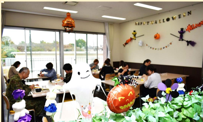
毎月多くの方々に来ていただいております！