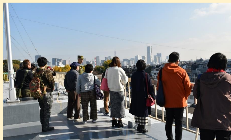
食事の後は屋上から駐屯地説明を行っています