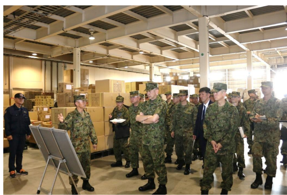
施設等巡視(補給倉庫)