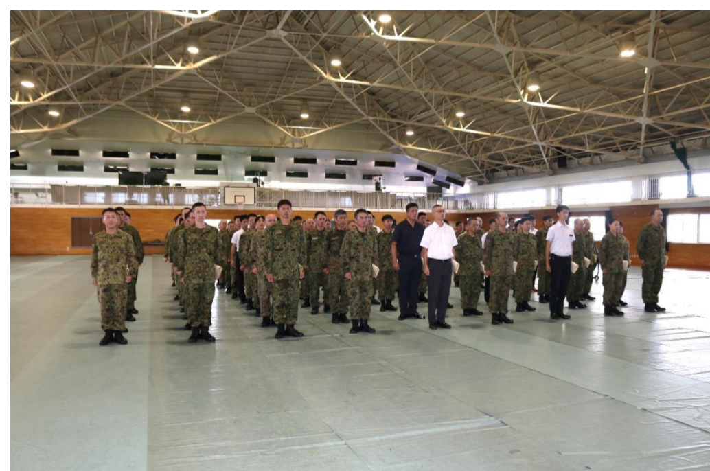
今回の表彰式で受賞した隊員たち

九州補給処は、令和7年7月24日(木)、前期定期表彰式を実施しました。表彰式では、職務遂行、車両無事故走行や隊員自主募集で特に活躍した隊員83名に対し表彰しました。