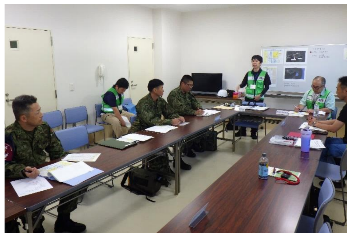
関係各機関との現地対策会議