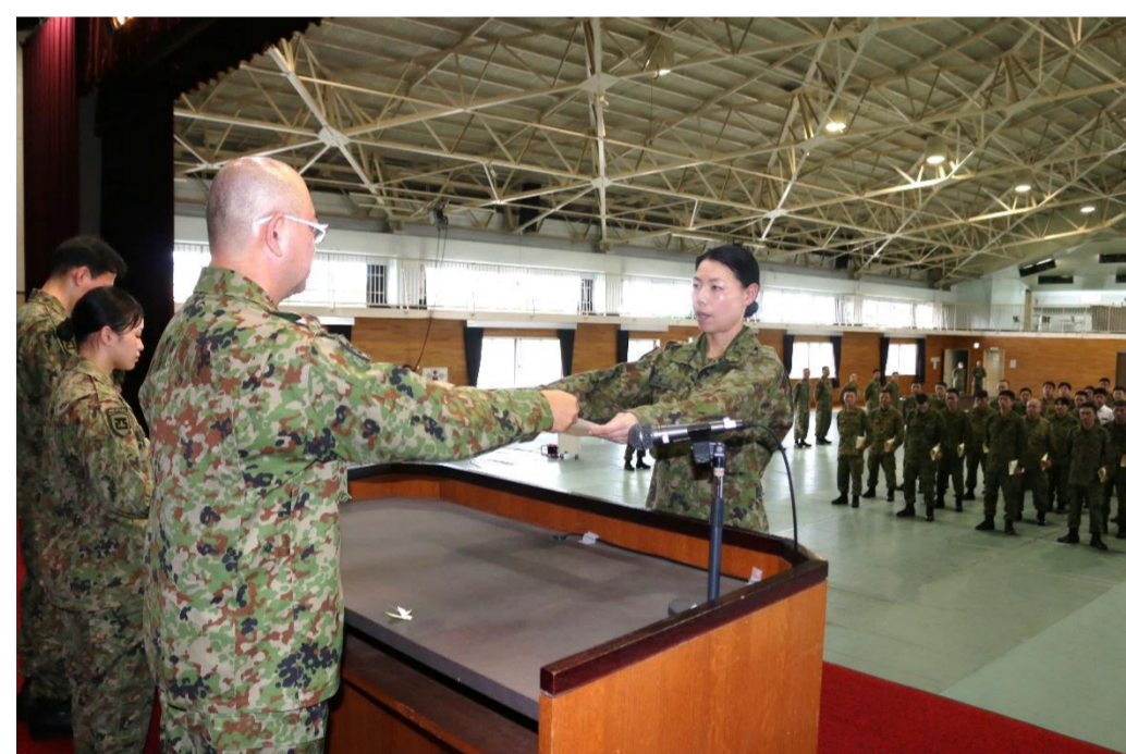
賞状を受け取る受賞者