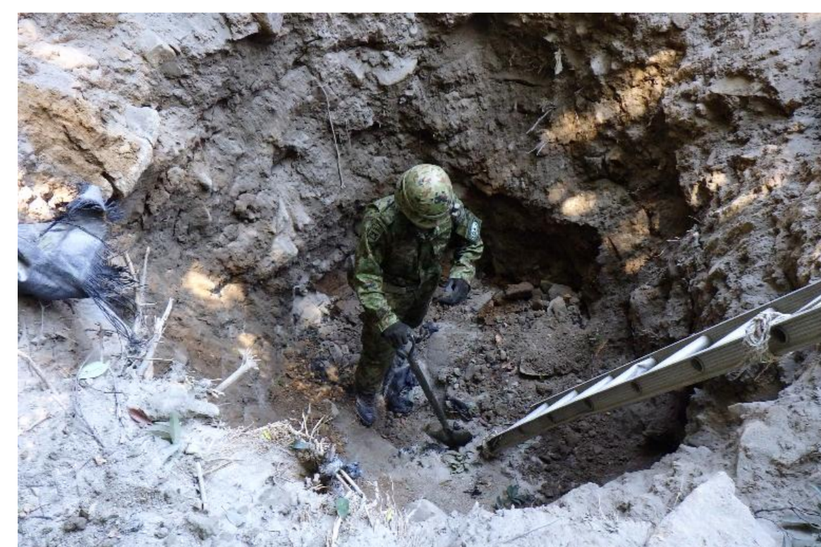
爆破処分成果の確認