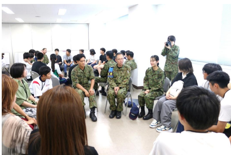
若年隊員との懇談