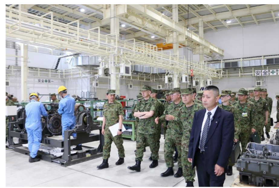
施設等巡視(整備工場)