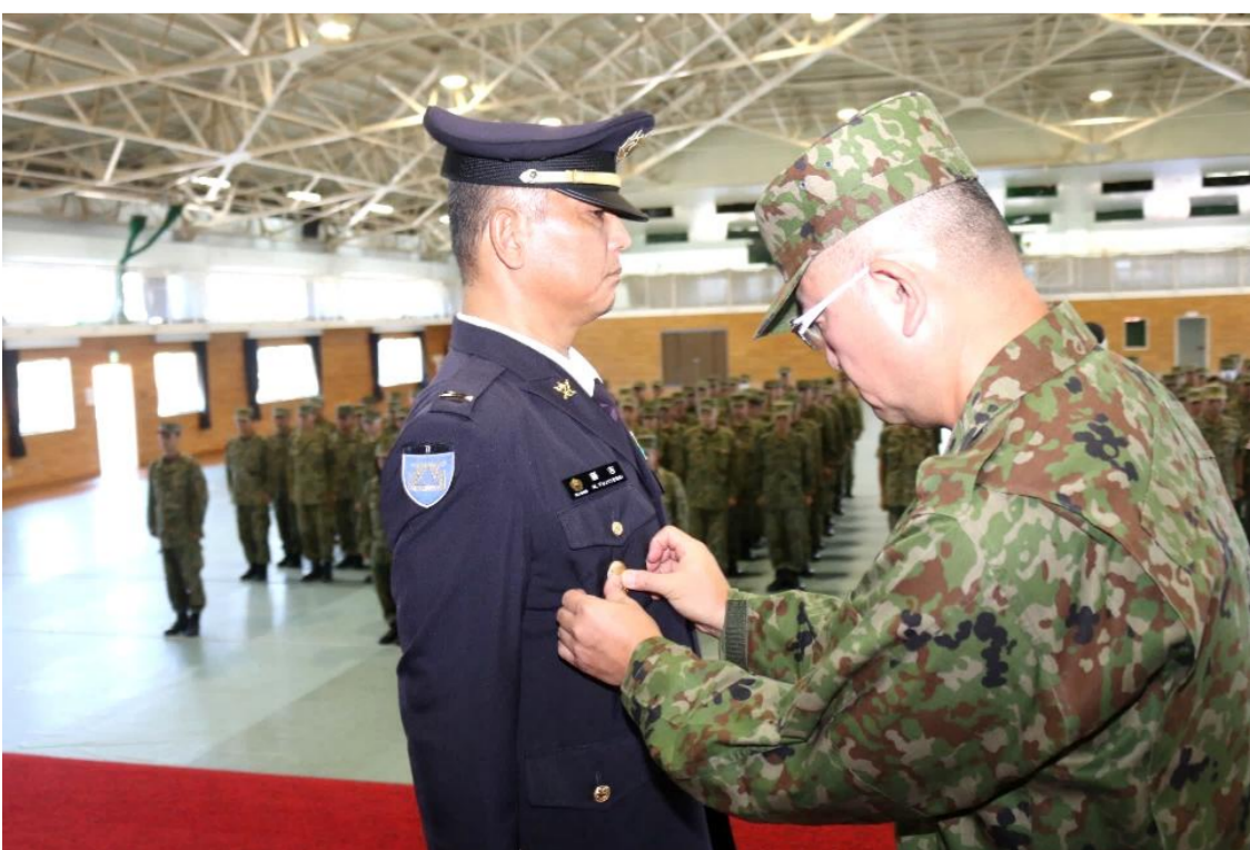
最先任識別章の授与

〈一言〉 最先任上級曹長の職を今一度よく知り、より好きになって身構えることなく処長の補佐、准曹士の発展に精進します。