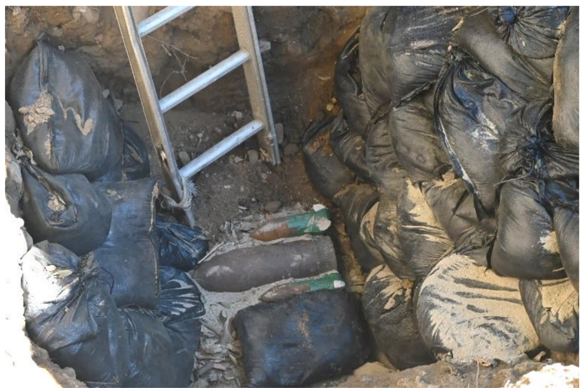
発見された不発弾3発