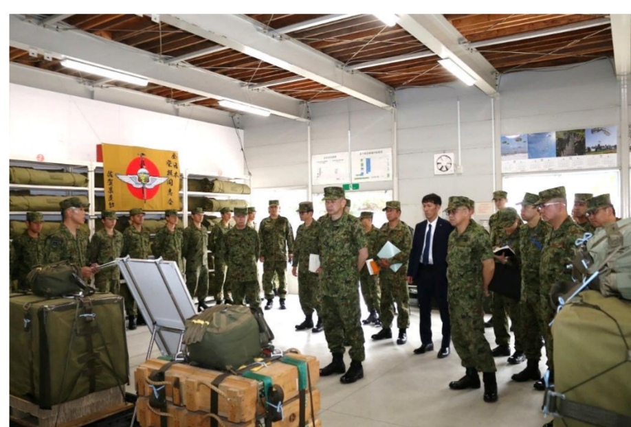
施設等巡視(投下支援小隊)