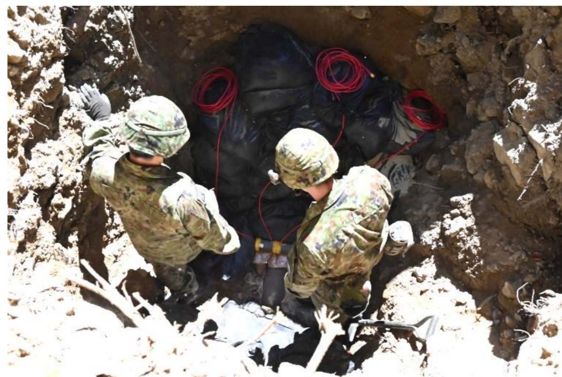
現地爆破処分の準備

西部方面後方支援隊第104不発弾処理隊(目達原)は、令和7年7月29日(火)、熊本県天草市御所浦町において旧日本軍の不発弾3発の現地爆破を実施しました。当日は半径およそ400メートルの立ち入りを規制し、付近の道路を全面通行止めとしました。不発弾は、町内の土砂捨て場に掘った深さ3メートルの穴に埋めた後、さらに高さ3メートルの土のうを積んで、爆破の際に破片が飛び散らないようにして爆破を行いました。引き続き民生の安定に寄与するため、不発弾処理業務に尽力していきます。