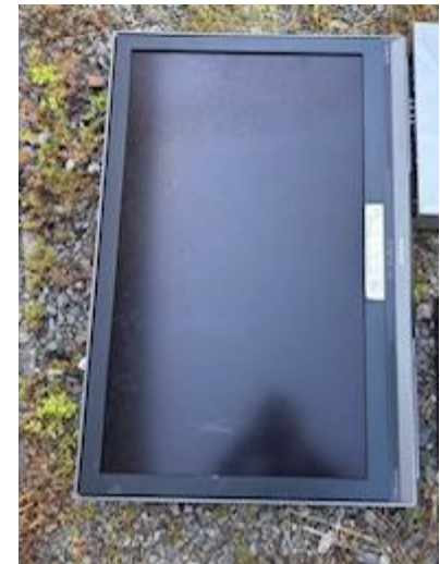
混合廃棄物 (廃プラ・金属くず・木くず等)