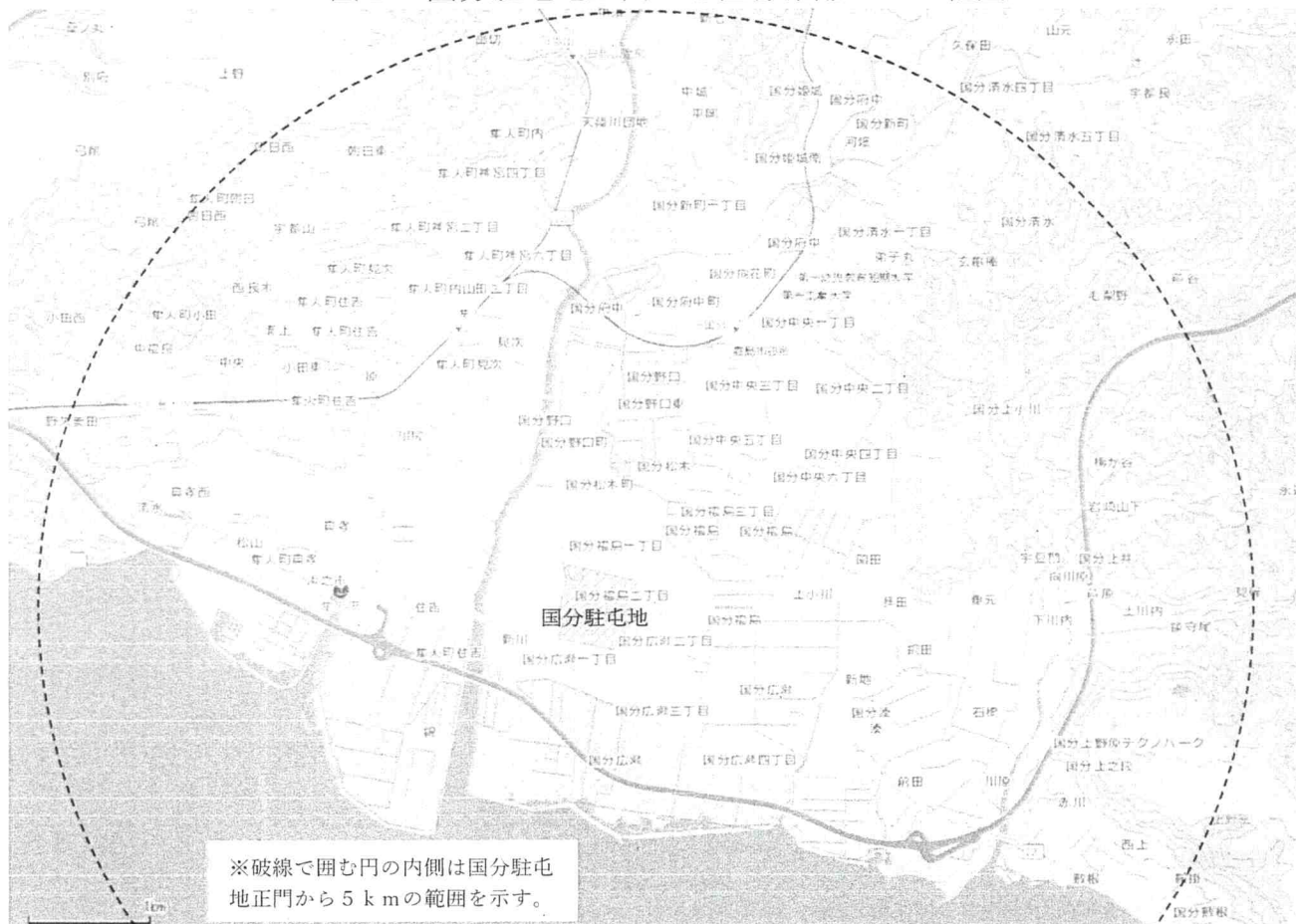
図2 国分駐屯地正門から直線距離5 km範囲

b) 食堂に供給するプロパンガスのガス漏れ等警報発生時については、通報を受けてから20分以内に現場に到着するものとする。また、それ以外の供給箇所については、30分以内に到着するものとする。