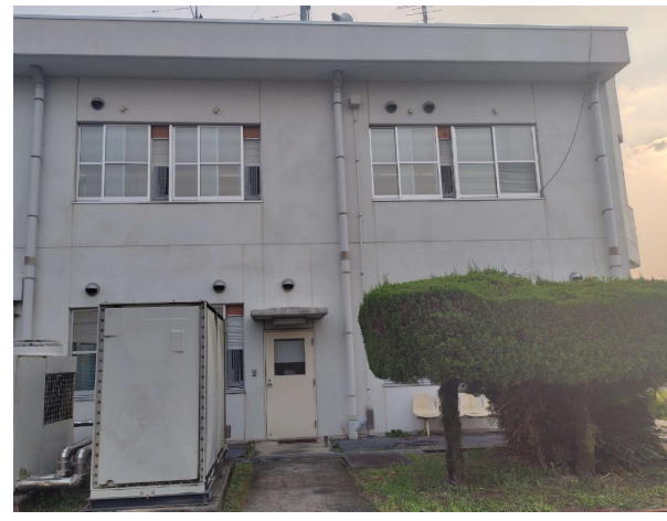
A・B室東側建物外観